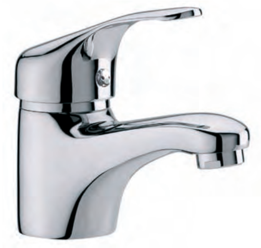
96068 Lavabo Basin Lavabo

96539 Con válvula automática abs With abs automatic valve Avec vidage abs automatique