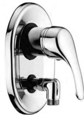
96106 Ducha empotrar sin inversor Concealed shower mixer without diverter Mitigeur bain-douche sans inverseur