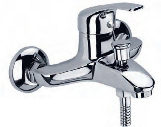
96070 Baño-ducha con equipo ducha Bath-shower with shower kit Bain-douche, accessoires inclus

97944 Con válvula automática latón With brass automatic valve Avec vidage laiton automatique