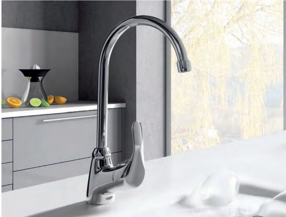
96072 Fregadero Caño conformado Sink Swivel tube spout Évier Bec façonné