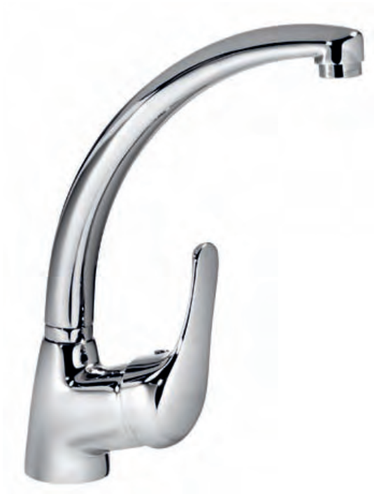
97674 Fregadero Caño conformado Sink Swivel tube spout Évier Bec façonné