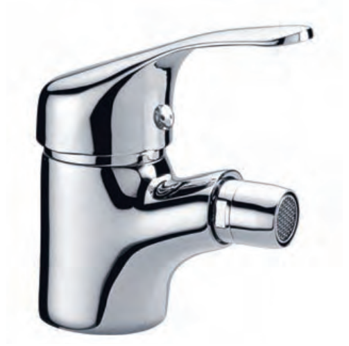
96069 Bidé Bidet Bidet

97943 Con válvula automática latón With brass automatic valve Avec vidage laiton automatique