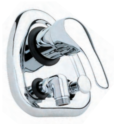
96107 Baño-ducha empotrar con inversor Concealed bath-shower mixer with diverter Mitigeur bain-douche avec inverseur