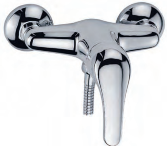
96071 Ducha con equipo ducha Shower with shower kit Douche, accessoires inclus