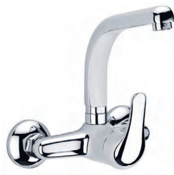
97669 Fregadero Caño conformado Sink Swivel tube spout Évier Bec façonné