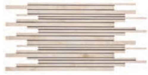
33x65 Muro Element Silver