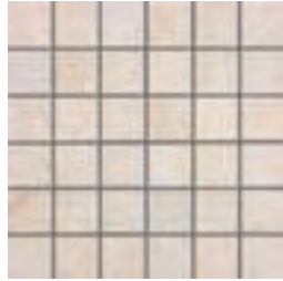
33x33 Mosaico Element Silver