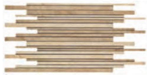
33x65 Muro Element Nut