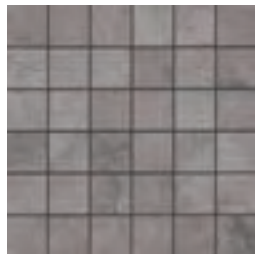
33x33 Mosaico Element Antrazit