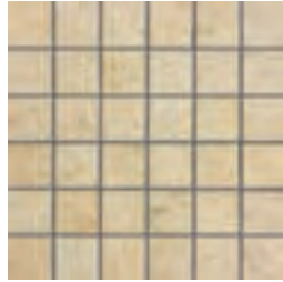
33x33 Mosaico Element Ivory