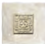
20x20 Decor D120 Burgos