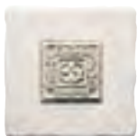
20x20 Decor D120 Santiago