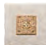
20x20 Decor D120 Roncesvalles