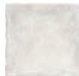
20x20 Camino de Santiago Somport