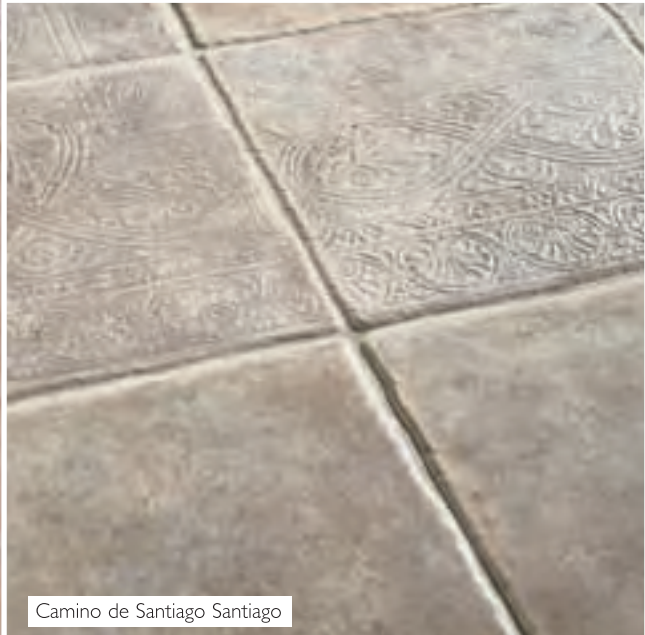
Camino de Santiago Santiago