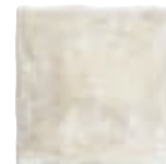
20x20 Camino de Santiago Burgos