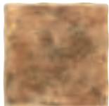
20x20 Camino de Santiago Roncesvalles