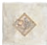
20x20 Decor Burgos Nassau